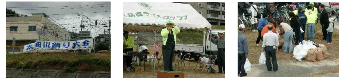
開会式 と 会場清掃の様子・・・