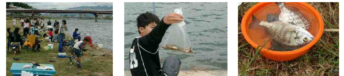
釣りを楽しみ・・・今日の釣果は・・・チヌをそれも2匹も釣った達人(?)も・・・