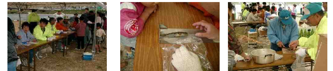
計量場に自慢のお魚を持って・・・大物賞(はぜ1匹の長さ)に期待して・・・